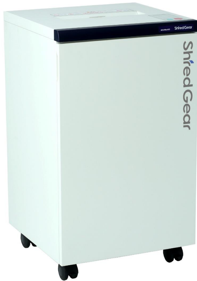
「Shred Gear shohka55」 標準小売価格688,000円(税別)